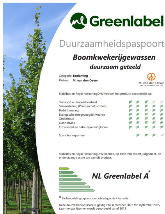
Figuur 1: Voorbeeld plantpaspoort

Sinds 1 juni 2015 voert Stabilitas B.V. in opdracht van NL Greenlabel deze beoordeling uit. NL Greenlabel geeft vervolgens de samenvatting van de resultaten weer in een duurzaamheidspaspoort dat met het product wordt meegeleverd. Zo is voor elke eindgebruiker altijd direct inzichtelijk hoe duurzaam iets is. Figuur 1 geeft een voorbeeld van een plantpaspoort.